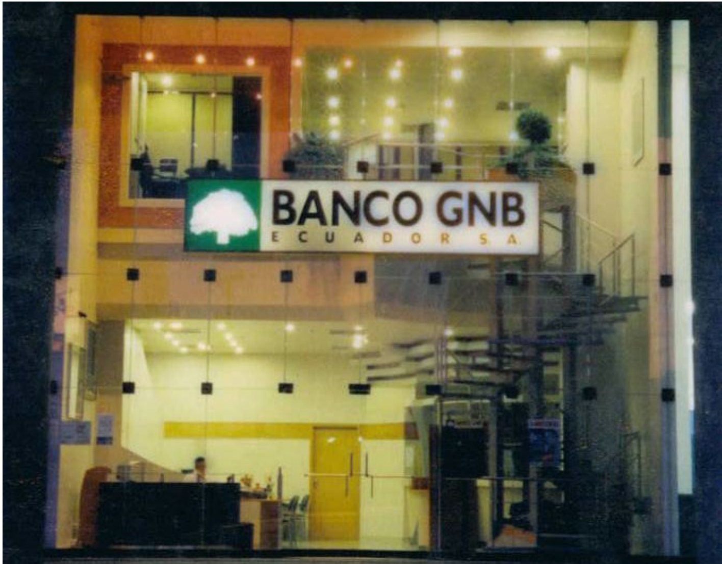
BANCO GNB - GUAYAQUIL