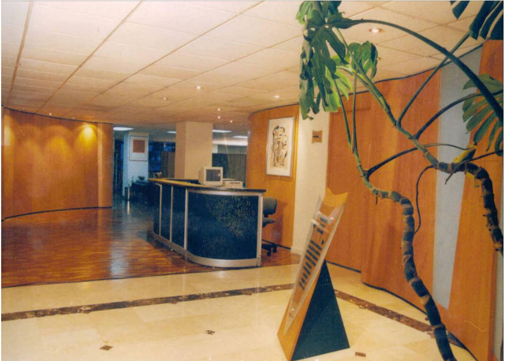
BANCO GNB - QUITO