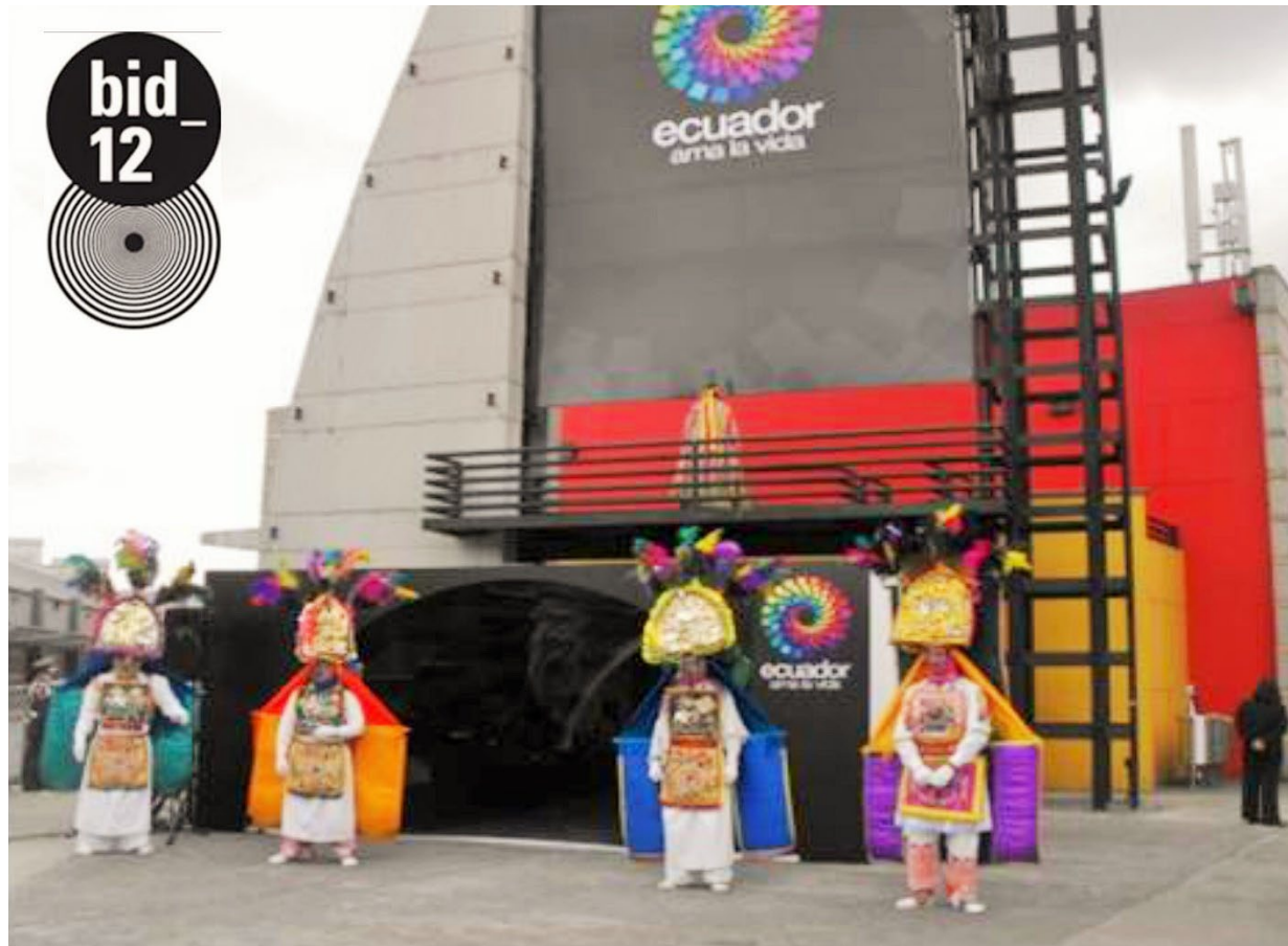
PABELLÓN ECUADOR – FERIA DEL LIBRO BOGOTÁ 2011 SELECCIONADO FINALISTA EN BIENAL IBEROAMERICANA DE DISEÑO MADRID – ESPAÑA 2012