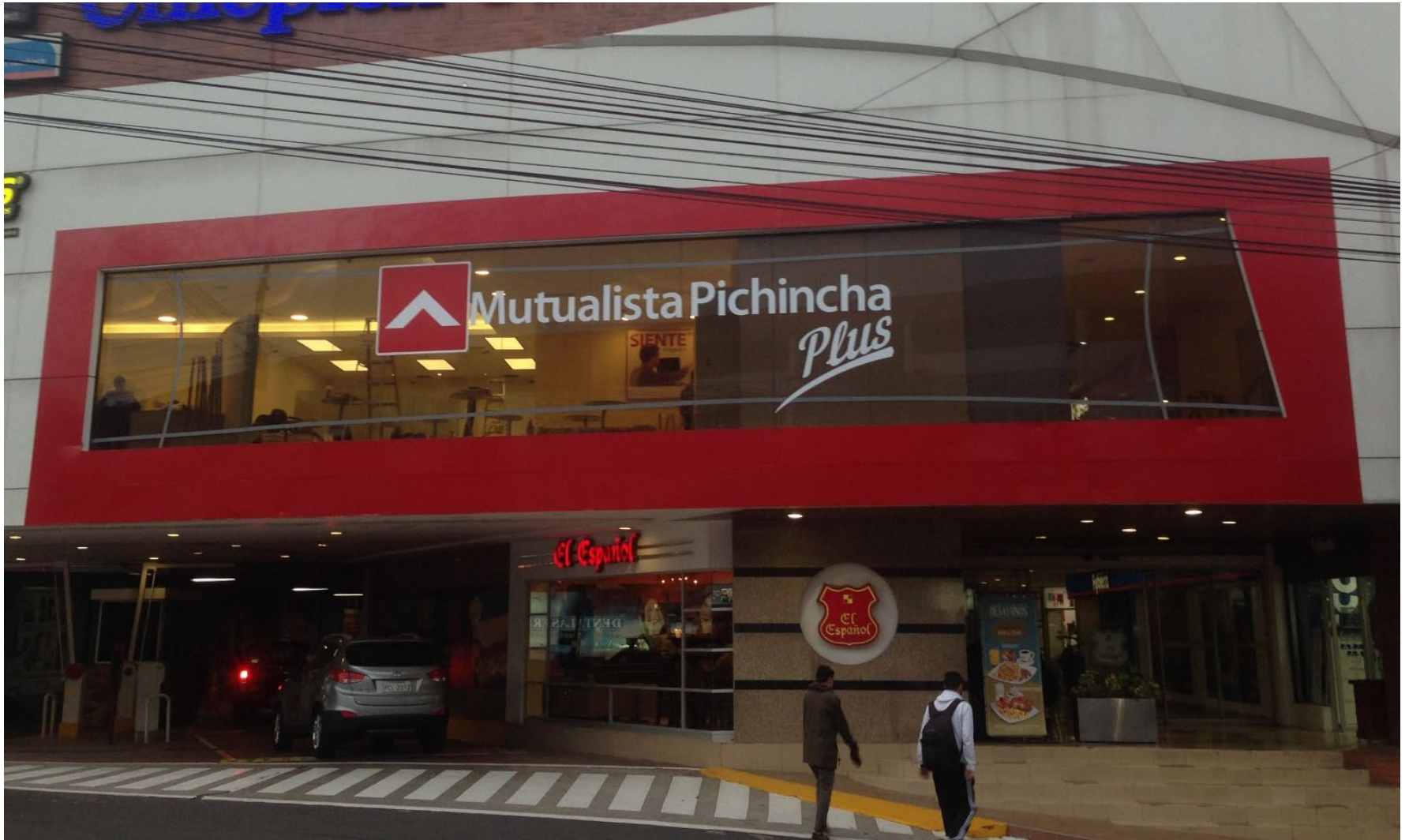
MUTUALISTA PICHINCHA – VENTURA MALL