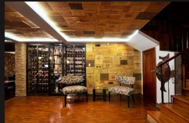
DOC - BAR DE EXPERIENCIAS CON EL VINO

Diseñado para la Cofradía del Vino del Ecuador en la ciudad de Quito en 2020, fue un proyecto creado con libertad, donde el cliente se abrió a que desarrollara una propuesta inspirado en mi pasión por el vino.