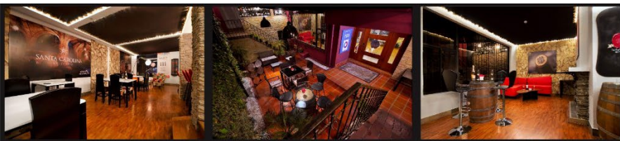
DOC - BAR DE EXPERIENCIAS CON EL VINO