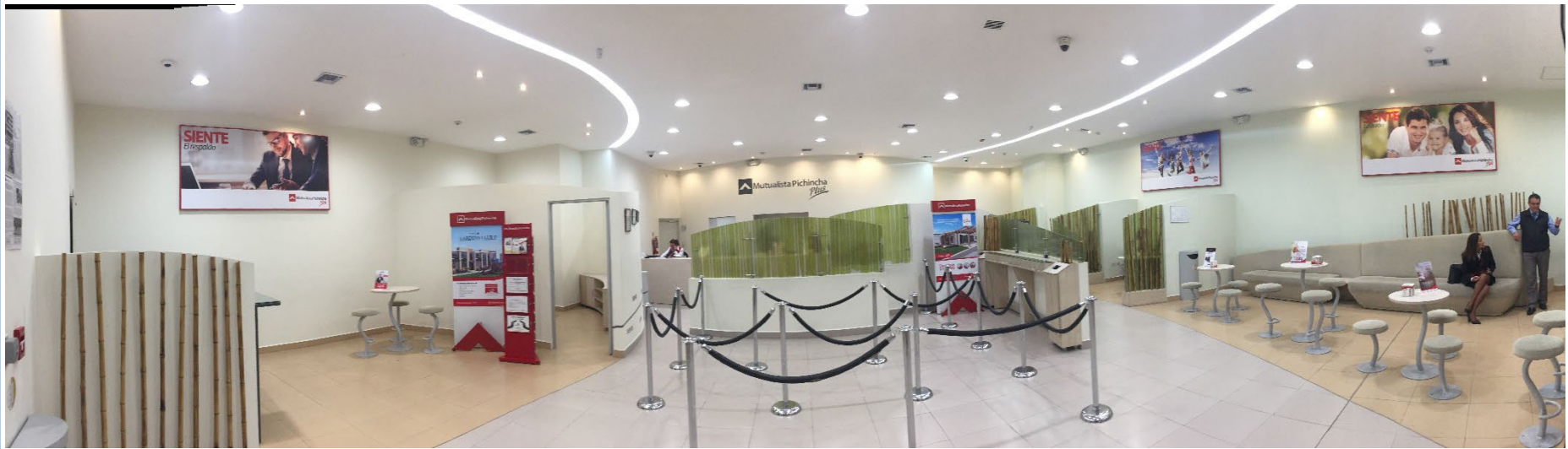
MUTUALISTA PICHINCHA – EL RECREO